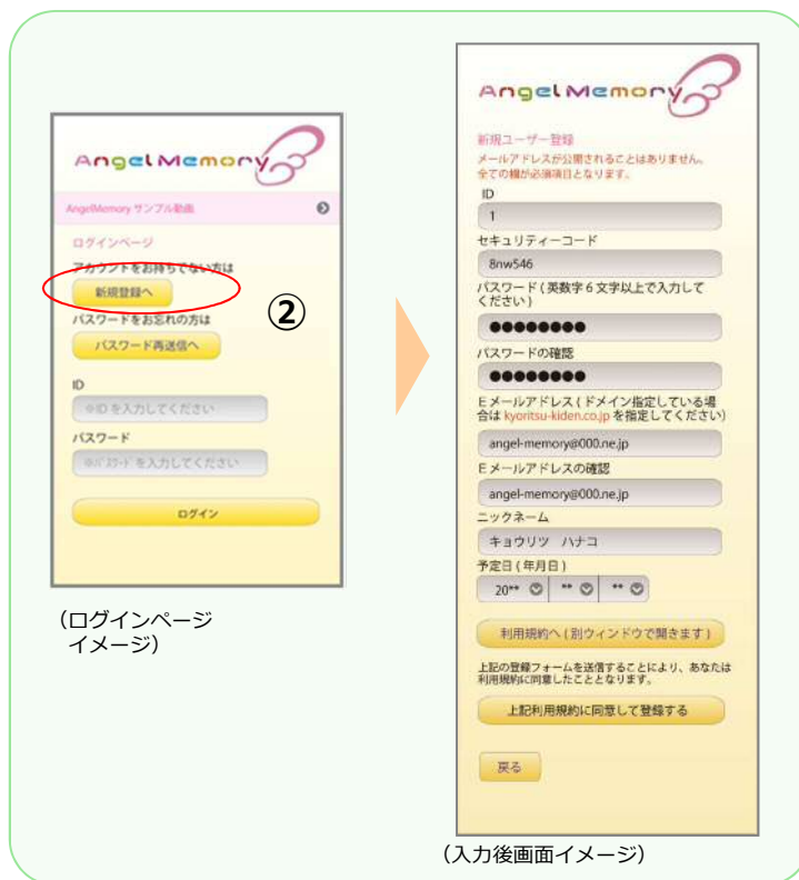
(入力後画面イメージ)